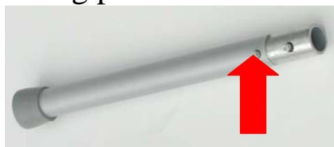
Fig 1. Press inwards to fasten or release a leg.

The TS is easily assembled by pressing in a button at the bottom of the legs, connect them under the seat by pressing the legs into a locking position.